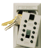
Porta chiavi a combinazione